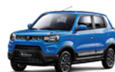
Azul Claro Perlado