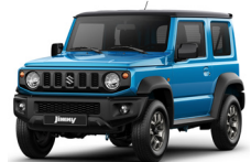
Azul techo negro