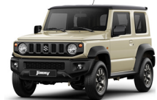
Marfil techo negro