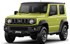
Verde lima techo negro