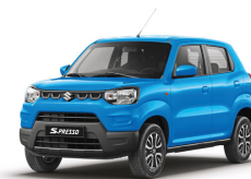
Azul Claro Perlado

La duración del vehículo dependerá de su correcto uso y ejecución de mantenimientos, indicados en el Manual de Propietario del vehículo. El vehículo contará con disponibilidad permanente de repuestos y servicio técnico en los Servicios Técnicos autorizados, salvo que se indique lo contrario.